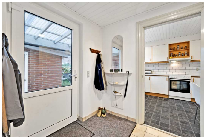
Indgang / bryggers