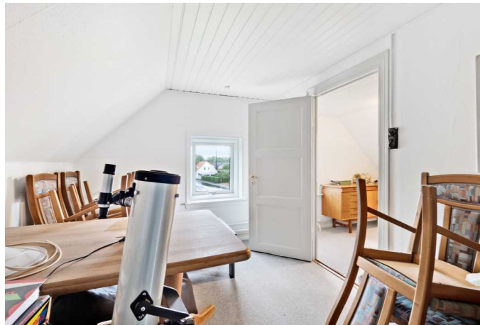
Værelse 1. sal