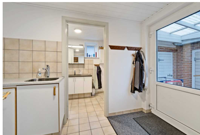
Indgang / bryggers