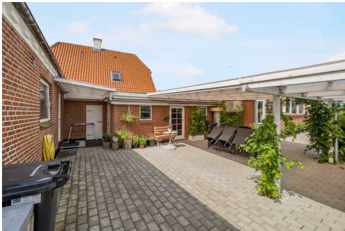
Gårdhave /overdækket terrasse