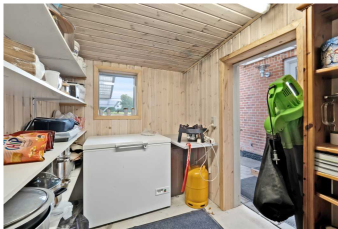
Disp. rum /vikualierum