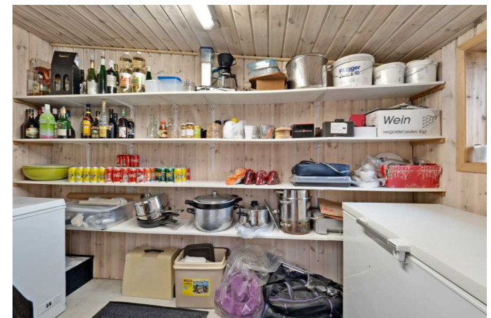
Disp. rum /vikualierum