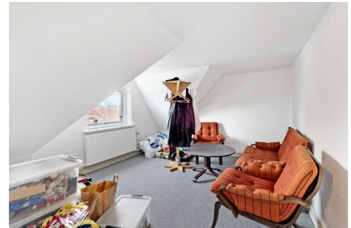
Værelse 1. sal