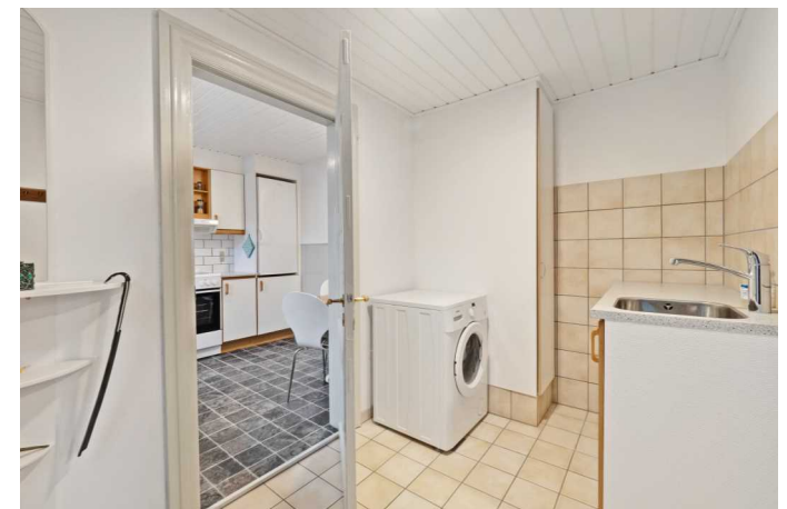
Indgang / bryggers