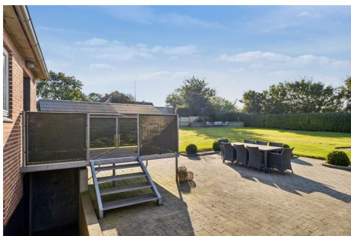
Terrasse / have