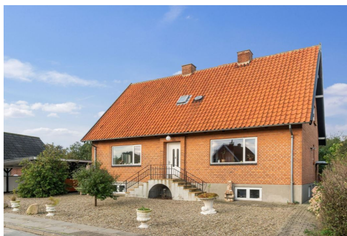
Set fra vejen