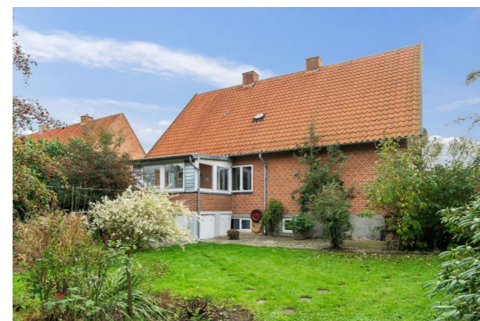
Set fra haven