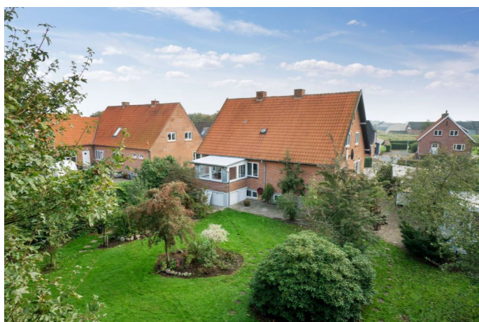
Ejendommen set fra haven