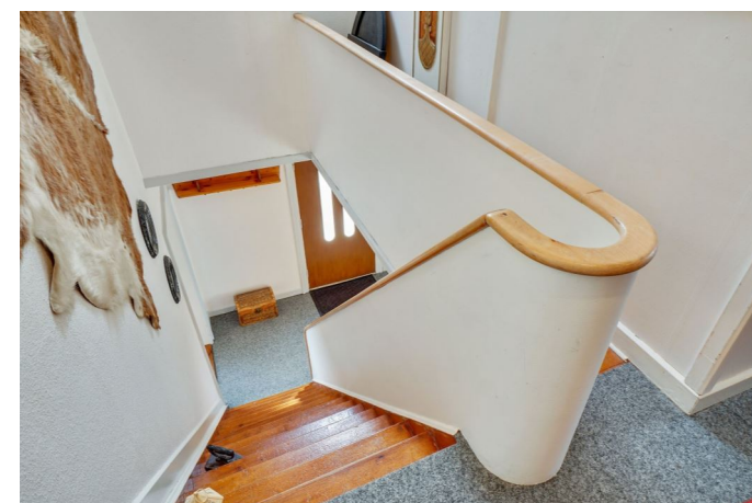
Repos / entre