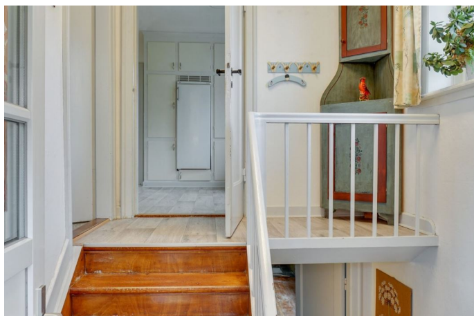
Nedgang til kælder