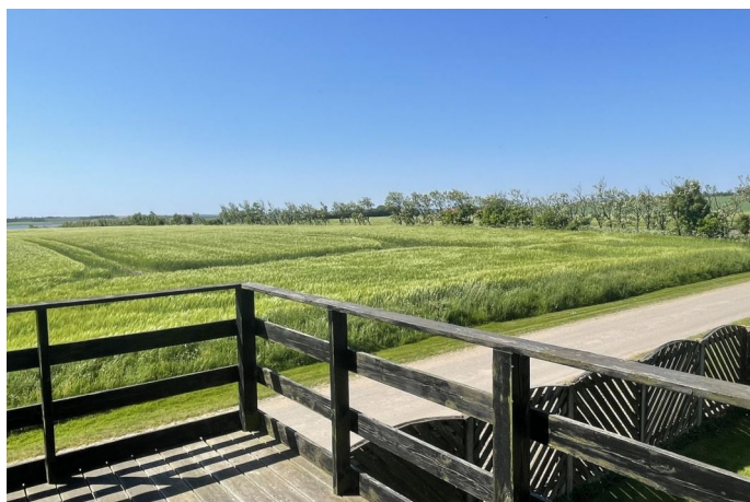
Udsigt fra ophævet terrasse