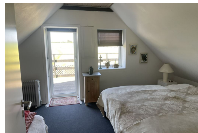
Værelse 1. sal