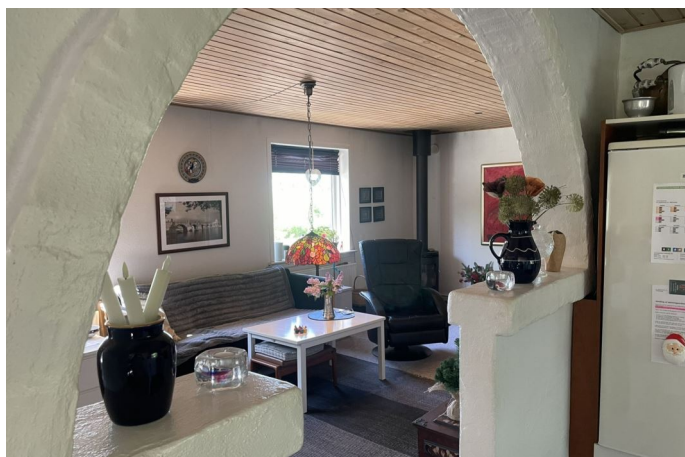
Køkken / stue