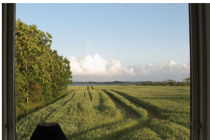
Udsigt fra kvist