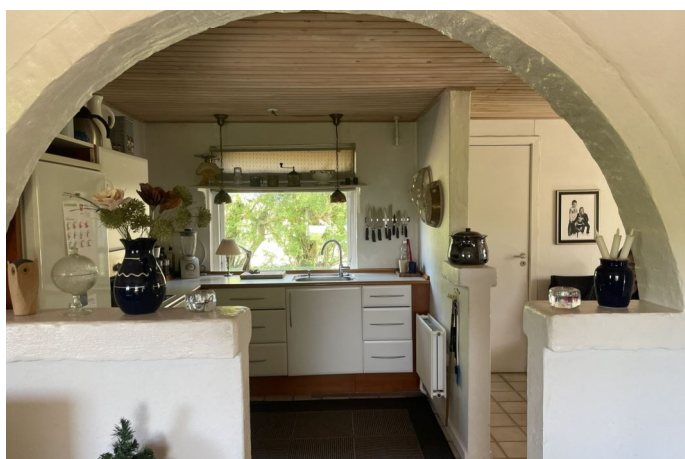
Stue / køkken