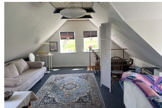
Stue - 1. sal