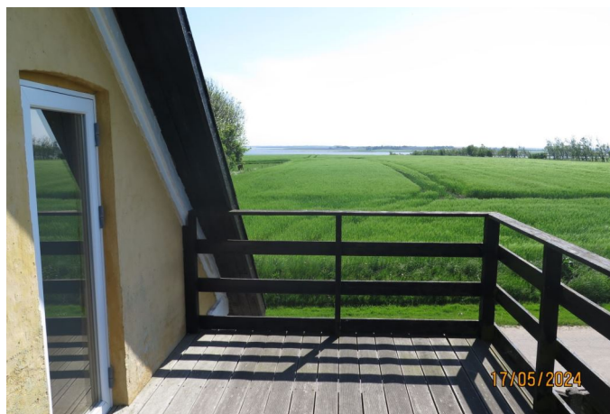
Terrasse 1. sal