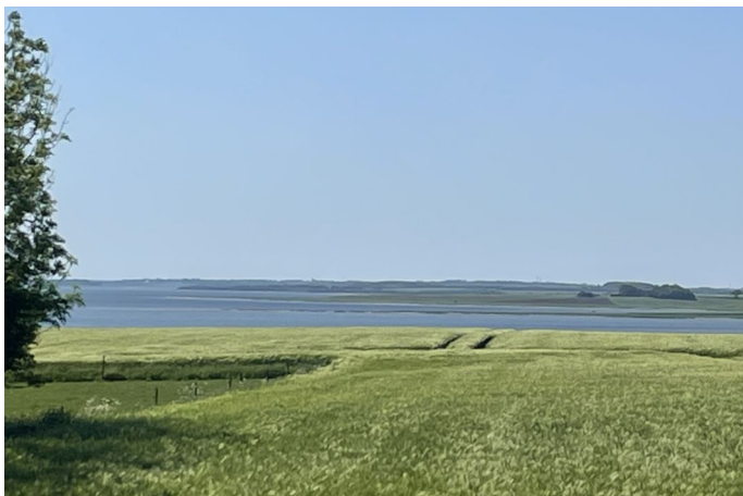
Udsigt fra ophævet terrasse