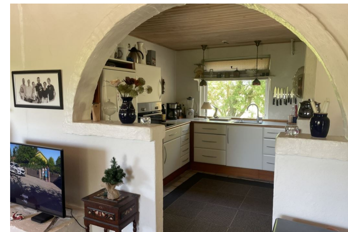
Stue / køkken