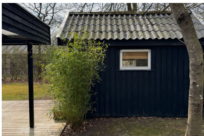
Udhus / Anneks