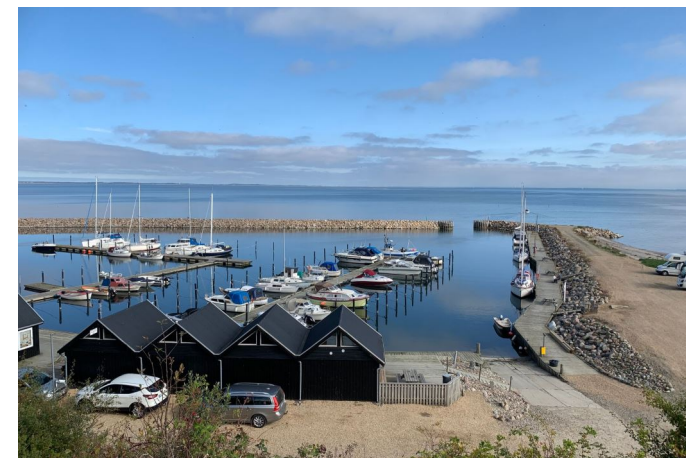
Området - Ejerslev Havn