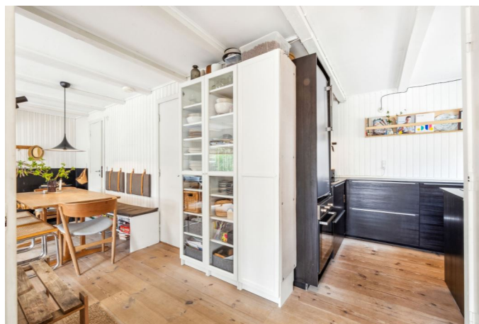
Køkken / Stue