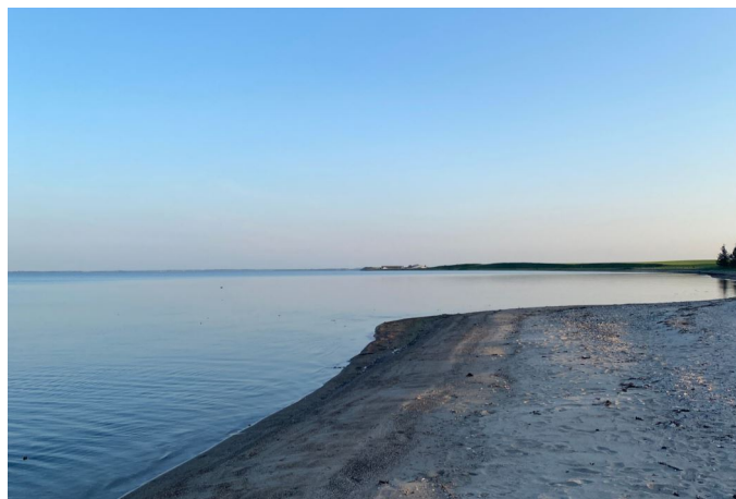
Strand og fjord