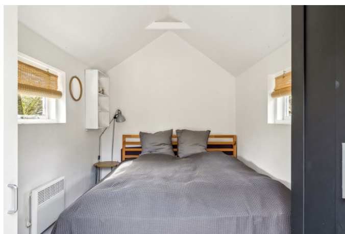
Udhus / Anneks