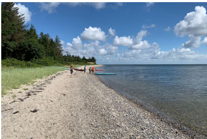
Strand og fjord