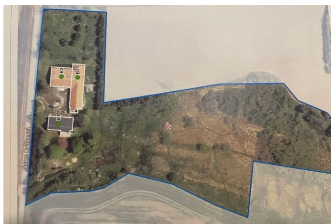
Kort over ejendommen