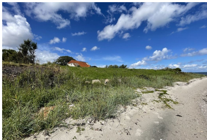
Set fra stranden