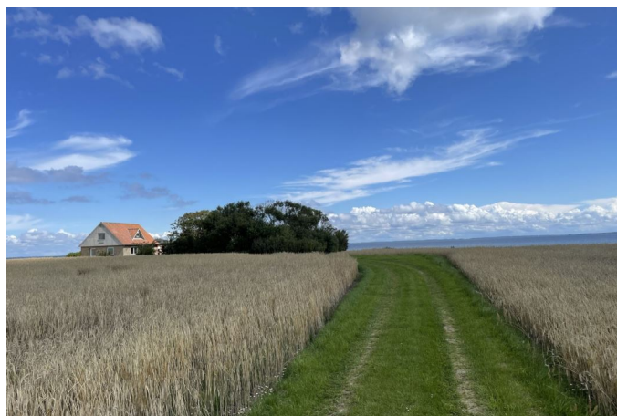
Set fra vejen