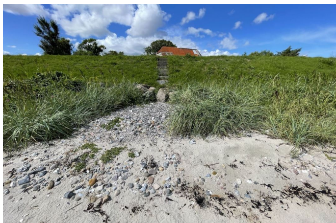
Set fra strand